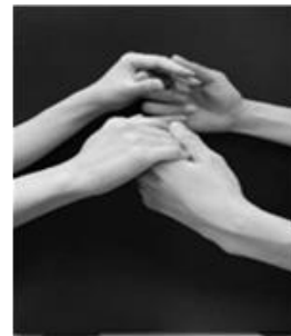
しよくしゅわ (触手話)

かい じょう ちようかくしょうがいしゃ 会場 あいち聴覚障害者センター じゆこうりよう む りよう きようさいとういちぶじっぴふたん 受講料 無料(教材等一部実費負担あり) しめ きり がつはつ か すい ひつちやく 締切 7月20日(水)必着