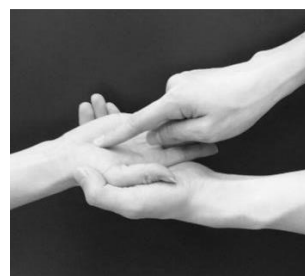
てのひらがき (手のひら書き)