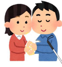
盲ろう通訳・介助員