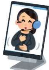
電話リレーサービス