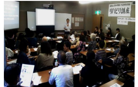
(リハビリテーション講座の 1 コマ)

年 3 回。難聴・中途失聴者の社会参加を目的に、聞く機会を提供。さまざまな企画で行われます。